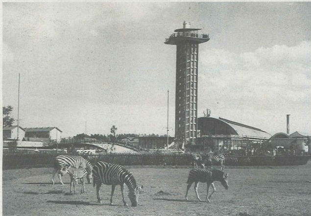
De fraaie vormgegeven 47 meter hoge uitkijktoren, waaraan menig Rotterdammer warme herinneringen heeft, werd in 1972 gesloopt.

De crisisjaren zorgden voor financiële problemen en besloten werd de Koninklijke vereniging te ontbinden. Omdat de gemeente het terrein aan de Kruiskade nodig had voor de aanleg van een nieuwe verbindingsweg werd een grondruil aangegaan naar het huidige terrein in Blijdorp. Toen in het voorjaar van 1940 de verhuizing naar het fraaie ontwerp van architect Sybold van Ravesteyn net was gestart, vielen op vrijdag 10 mei achttien brandbommen op de oude diergaarde. Op de dag van het bombardement, 14 mei, werd de gehele diergaarde getroffen. Alles ging in vlammen op. Olifant Sonny liet zich gewillig uit het verblijf halen naar de nieuwe diergaarde. Andere dieren werden elders ondergebracht. Zoals de chimpansee Josefijntje en de orang-oetan Agam, die werden opgesloten in de toiletten van een café aan de Diergaardesingel. Andere dieren logeerden tijdelijk in de oude Haagse diertuin. Op 7 juli 1940 werd Diergaarde Blijdorp officieel in gebruik genomen. Ondanks voedselschaarste slaagde het personeel er in de levende have door de oorlog heen te loodsen.